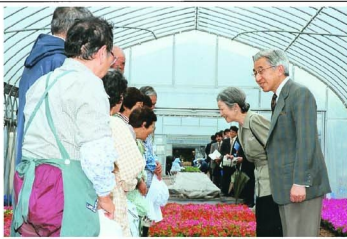
島民に声をかけられる内陸下

今月の人口 人口 3,363人 世帯 1,712世帯 (5月1日現在) 編集 三宅村総務課 ☎ 03 (5320) 7824