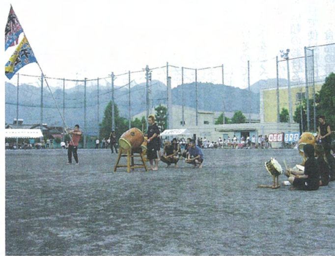
都立五日市高校との合同体育祭の三宅高校応援団

三宅島の自然や文化、産業を学んできましたが、これからは、さらに積極的に三宅島の緑化に貢献していく予定です。 学校としての取り組みは、苗木の生産方法の研究・ガスに強い植物の発見など、いろいろ考えています。この取り組みには都立園芸高等学校(世田谷区)と連携して苗木の生産なども予定しています。園芸高校との連携のスタートとして、7月8日に園芸高校で連携開始のセレモニーと1回目の作業として挿し木を行いました。 (都立三宅高等学校副校長)