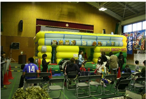
ふわふわバルーン