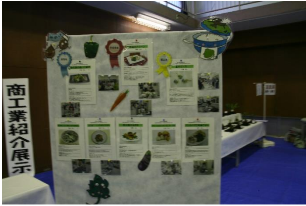
料理コンテスト入賞作品展示