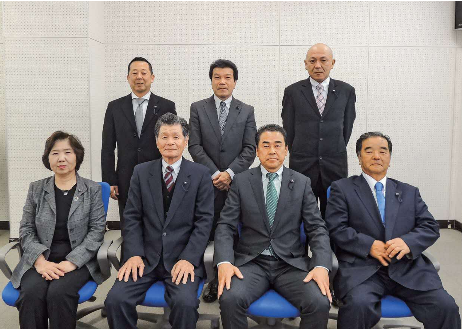
写真：三宅村議会議員一同（初議会終了後）※水原議員については療養中のため欠席。