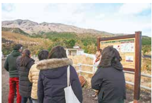
参加者にジオスポットを紹介する自然ガイド

2月6日から2月12日に(短期コースは2月10日まで)第8回目となる「三宅村島ぐらし体験事業」を実施し、8人の方が参加しました。