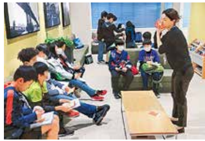
プログラム体験中の子どもたち

平成31年1月23日(水)から25日(金)まで三宅中学校の1年生、三宅小学校6年生が株式会社TOKYO GLOBAL GATEWAYが提供する東京版英語村で