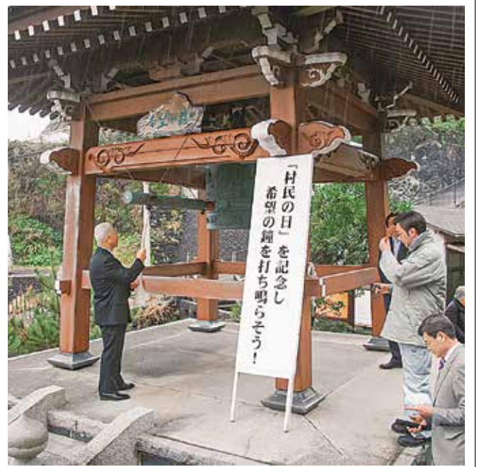
希望の鐘を突く櫻田村長