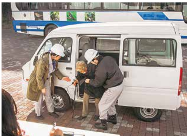
避難訓練中の住民と村職員

特に要支援者の避難には、親類や地域住民、消防団などの協力が必要不可欠ですが、多くの方が平日は仕事であるため、即時対応することが難しいと考え