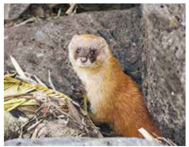
彼らに罪はないのだけれど...

例えば三宅島のタラノキはトゲが少ないですね。これは草食の哺乳類がいらないため身を守る必要がないからです。鳥も、肉食の哺乳