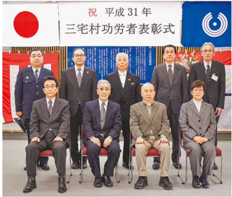
写真に納まる平成31年三宅村功労者ら

平成31年三宅村功労者表彰式が、「村民の日」の2月1日(金)午前10時から三宅村役場臨時庁舎において行われ、「各界の功労者」に表彰状と記念品が贈られました。