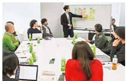
ブランド化に向けて議論をする参加者

東京島しょ地域のブランド化を目指す東京宝島事業の一環として、今年度、島会議を開催している4島(大島、神津島、三宅島、八丈島)では、各島の事業者が中心となって、自らの島の価値は何か、どのような人々に、どのように共感をして欲しいかなどのブランド化に向けた議論を重ねています。1月29日に開催された第2回東京宝島会議