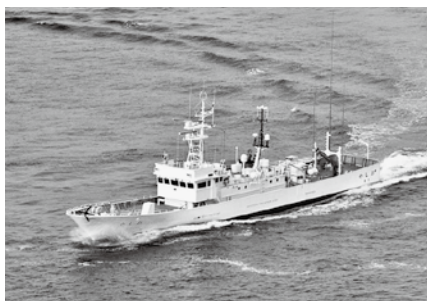
試運転中の新船「やしお」

東海沖を大きく遠く離れて流れる大蛇行流路(A型)になって以来、現在も続いています。昨年12月に水産庁が発表した7月までの長期予測では「黒潮は、引き続きA型で推移することです」。 三宅島周辺では黒潮の影響を受けて、水温が「高めで推移することが