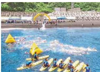
一斉にスタートした2.5キロと5.0キロ個人競技

「挑むは黒潮」を合言葉に、7月7日「三宅島OWS大会2018」が大久保浜海水浴場で開催されました。OWSとは、オープンウォーター・スイミングの略で、海・川・湖などの自然環境下で開催する水泳競技であり、オリンピックの正式種目です。三宅島では2回目となる今大会には、4人1組で参加するチームを含め、総勢99人の方が島内外から参加しました。