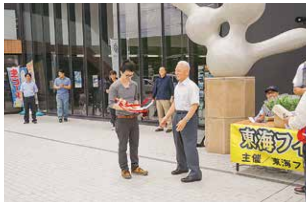
表彰式でのトロフィー授与

6月17日、東海フィッシングクラブ(TFC)主催「三宅村長杯争奪三宅島磯釣大会」が開催され、40人が参加しました。参加者は早朝に船で三宅島に到着するとともに、石物、メジナ、ブダイ、他魚の4部門で競い合うために島内の各釣り場へと別れ、最後に当日の出帆港である錆ヶ浜港にて集合し、検量が行われました。各部門の1位から3位までが、その後の表彰式で表彰され、お土産が当たる抽選会も行われました。