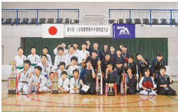
大会に出場した小・中学生たち

7月8日、「第8回三宅島署少年柔剣道大会」が三宅村コミュニティセンターにて開催されました。大会には御蔵島からの剣道選手8人も含め、小・中学生合わせて36人が出場し、優勝目指して熱戦を繰り広げました。