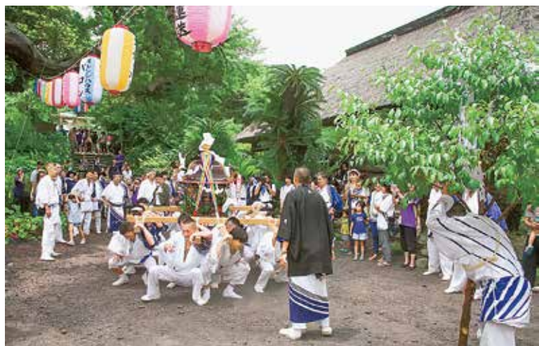
御輿をもむ担ぎ手たち

7月14日、15日の2日間、五穀豊穣・大漁・家内安全・無病息災の祈願する「牛頭(ごす)天王祭」が行われました。 14日は御笏神社にて宵宮がにぎやかに行われ、翌15日は午前8時半から保育園御輿(みこし)、続いて11時には大人御輿と小学生御輿が宮出しされました。地区内を巡りながら所要所で御輿を力強くもむ(御輿を大きく上げ下げする)担ぎ手の姿は、とても迫力があり圧巻でした。午後8時に巡行を終えた御輿は無事に御笏神社へ納められました。