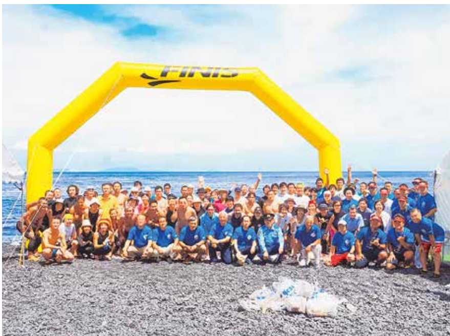
大久保浜海水浴場でOWS大会の参加者ら