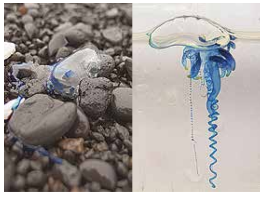
なが〜い触手にご用心「カツオノエボシ」

透明なブルーでキラキラひかるヘンなもの。初夏から秋にかけて南西の風が強く吹くと浜に漂着していることがあります。とつとも綺麗でつつい拾ってみたいですね。でもちょっと待ってください。この正体はカツオノエボシ。電気クラゲというあだ名もある危険な生き物です。実際には電気は流れませんが、毒があり刺されると激しい痛みがおきます。海に浮かんでいるものはもちろん、浜に打ち上げられ死んでいるものにもその毒があり、