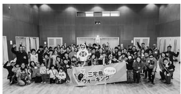
スタート前の参加者