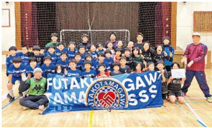
交流を深めた両チームの選手たち

1月29日、二子玉川小学校にて二子玉川スポーツ少年団サッカー部(以下、二子玉川SSS)と交流試合を行いました。FC三宅は小学3年生から6年生の16人で参加し、二子玉川SSSの選手とフットサル講習や試合を楽しみました。