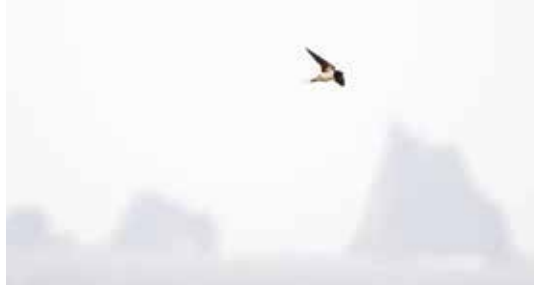
体重20gほど。小さな体で長距離を移動します

暖かな日が増え春を感じる事も多くなってきました。子育てのため南の国からやってくる「ツバメ」も春を感じますね。三宅島には3月中旬頃にやってくる。とても身近な野鳥ですが、全国的に減少しています。エサとなる虫が減った事や巣を作る軒のない住宅が増えた事などが原因です。三宅島でも昔に比べて少なくなりました。話を聞きます。伊豆諸島ではこの鳥でも見られま