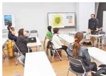
三宅島観光協会では話を聞く参加者

第17回島ぐらし体験事業が2月15日(水)から19日(日)までの4泊5日の日程で実施され今回は、島外から6人の方が参加しました。 初日は、三宅島の概要や島内事業所巡りなどを行いました。2日目以降は、オリエンテーションや島内事業所の個別見学、明日葉摘み体験を行い島民の方々と交流を深めました。 プログラムの最後に意見交換会を実施し「島のことほとんど何も分からなかったが、体験を通じて島の生活がイメージ出来た」「三宅島の方がすごく優しい人ばかりで驚いた」などの感想が述べられました。 三宅島観光協会では、島外の方々が気軽に島を訪れるきっかけづくりとして、島ぐらし体験事業を開催しています。 三宅島観光協会 ☎0992-0992