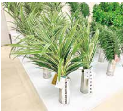
キキョウラン(金賞・銀賞)