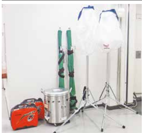
災害救援用の資機材

1月29日、二子玉川小学校にて二子玉川スポーツ少年団サッカー部(以下、二子玉川SSS)と交流試合を行いました。FC三宅は小学3年生から6年生の16人で参加し、二子玉川SSSの選手とフットサル講習や試合を楽しみました。